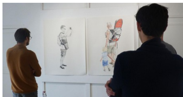
Présence de l'artiste dans son atelier au 1er étage