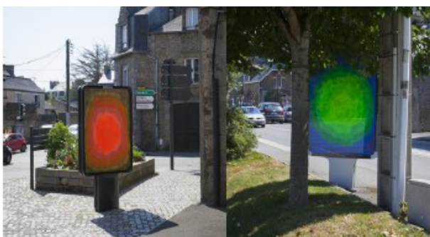
Peintures dans les affiches publicitaires JC Decaux