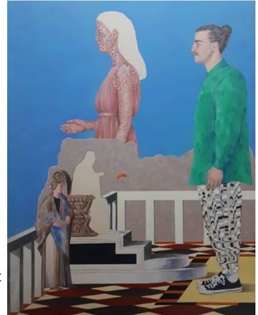
Les Choses qui sont cachées derrière les Choses, 2018 Huile et acrylique sur toile, 162x130 cm

Mes peintures sont souvent des espaces clos, des scènes d'intérieur. Je travaille à partir de sources multiples : photographies que je prends, textures glanées sur Internet, détails d'œuvres... Je peins des objets familiers, des personnes de mon entourage, et tente d'entrelacer cette histoire personnelle à d'autres objets provenant d'époques et de civilisations différentes, j'utilise parfois des codes de représentations issus de l'histoire de la peinture et notamment ceux des Primitifs.