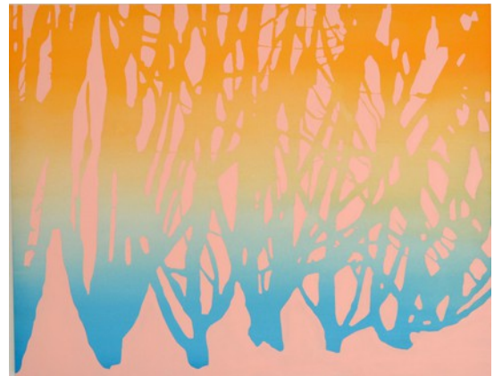
Tree trunks, 2018. Acrylique sur toile, 105x140cm

Née en 1984 en Grande-Bretagne. Elle vit et travaille à Marseille. Diplômée de The Glasgow School of Art (Ecosse) et de l'École supérieure d'art et de design Marseille- Méditerranée.