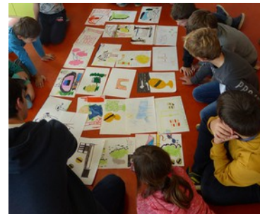
J-2 : réalisation de travaux individuels et création d'une histoire commune pour les œuvres collectives