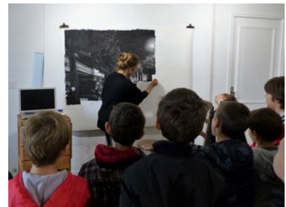
J-1 : Dans les ateliers des artistes en résidence et à la découverte du Musée Yvonne Jean-Haffen