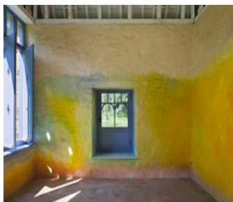
Certaines peintures se promènent, Gloriette, jardins de l'Abbaye de Léhon, 2018.

Eau de chaux, pigments. Réalisé dans le cadre de Territoires extra.