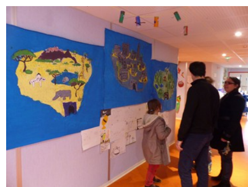
J-3 et J-4 : réalisation d'œuvres collectives, accrochage et vernissage en présence des parents