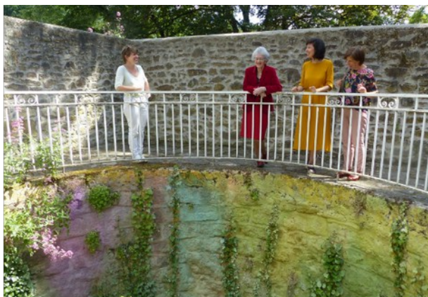
Four à chaux

Fréquentation d'environ 80 personnes, publics curieux d'en savoir plus sur les œuvres de Flora et sa pratique artistique, notamment l'installation dans le four à chaux.