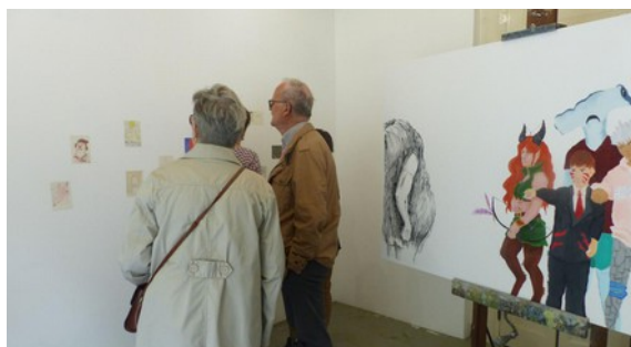
Présentation au rez-de-chaussée des actions artistiques

133 personnes ont été accueillies lors des portes ouvertes.