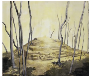
Eldorado , 2017. aquarelle sur papier, 93x106cm

Né en 1989 à Avignon. Il vit et travaille à Paris. Diplômé de l'École Nationale Supérieure des Beaux-Arts de Paris.