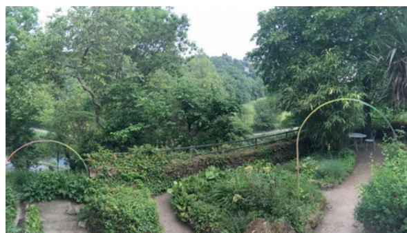
Les arceaux de la Grande Vigne peintes par l'artiste